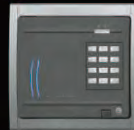
XR10TSA(2 個用スイッチボックス埋込テンキーモデル 黒)