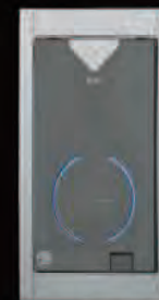
XR01SA(1 個用スイッチボックス 埋込スイッチあり 黒)